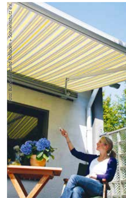
Damit der Garten voll genossen werden kann, darf beim Frühjahrsputz nicht die Markise vergessen werden

Weitere Informationen zu den Rollladen- und Sonnenschutzprodukten und ihren Funktionen sind auf www.rollladen-sonnenschutz.de zu finden.