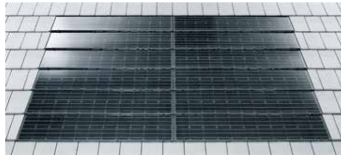
Das Braas Indach-System PV Premium fügt sich in die Dacheindeckung ein und bietet kaum Angriffsfläche für Wind

Dass jede einzelne Dachkomponente über eine hohe Qualität verfügt, zeichnet noch kein komplettes