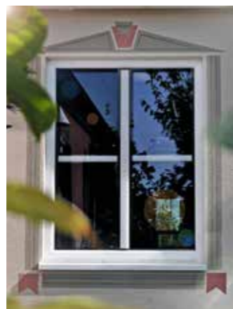
Glas und Rahmen sollten beste Dämmeigenschaften aufweisen, um möglichst viel Energie einzusparen

Je nach Größe und Art eines Fensters beträgt der Rahmenanteil zwischen 15 und 35 Prozent der Fensterfläche. Um durch einen Fen-