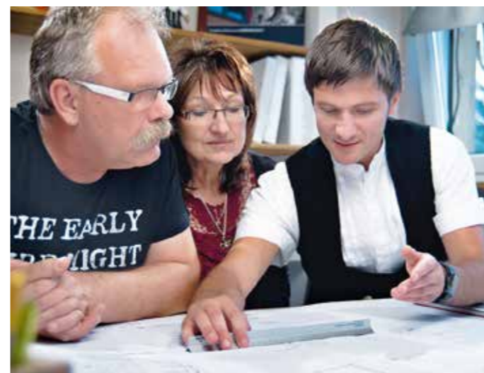
Die Arbeit beginnt bei der Beratung – DachKomplett-Betriebe finden die Lösung, die zu Ihren Anforderungen passt

jetzt unter dem Dach unmöglich. Es klingt paradox, doch eine Wärmedämmung leistet gerade im Sommer wertvolle Dienste. Eben-