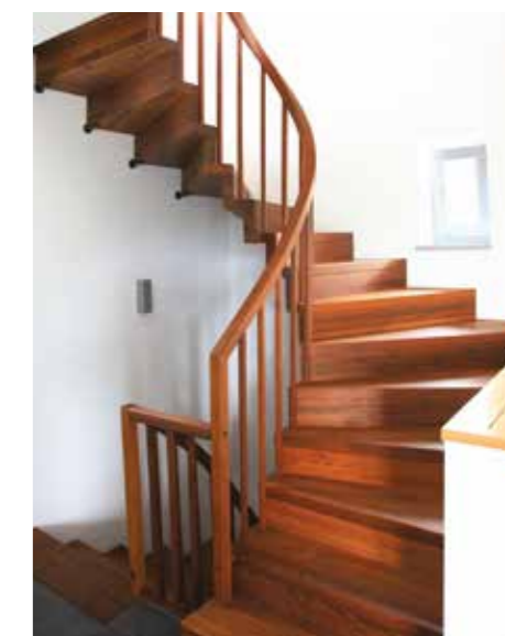
Faltwerkterppe in geölter Akazie. Zum Festhalten gibt es einen Handlaufkrümmling