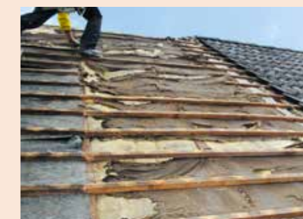
So sieht es unter vielen Dacheindeckungen aus. Teure Energie wird unnötig „verheizt“

Wenn der Dachspeicher nicht als Wohnraum genutzt wird, kann anstatt der Dämmung der Dachfläche nach der geltenden Energieeinsparverordnung (EnEV 2014) auch die