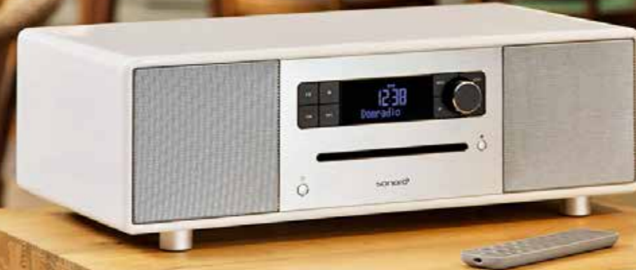
Foto: Hört sich gut an