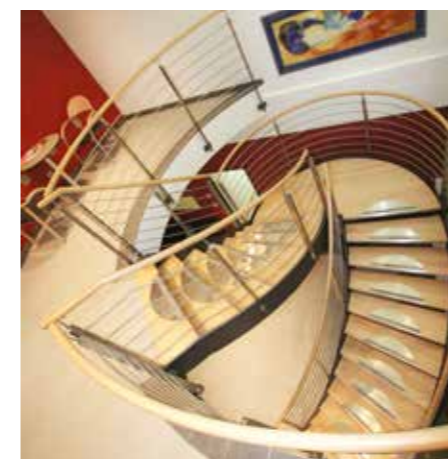
Moderne Flachstahlwängentreppe mit Stufen in Ahorn und geschwungenem Edelstahl-Reelingsgeländer

Treppenqualität auf höchster Stufe, das ist der Anspruch von Arktic-Treppen. Das umfangreiche Lieferprogramm enthält eine Vielzahl unterschiedlichster Modelle.