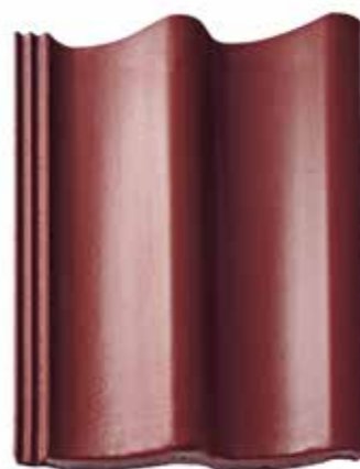
Das Dachsteinmodell Doppel-S verleiht Häusern einen authentischen nordischen Charme

Das Dach erfüllt heutzutage längst nicht mehr nur eine klassische Schutzfunktion gegenüber äußeren Umwelteinflüssen wie Hagel und Sturm. Stattdessen geht der Trend immer stärker hin zum