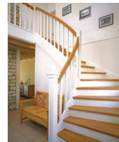
Geschlossene Massivholzwängentreppe in Weiß. Dazu farblich abgesetzte Stufen und ein Handlauf in Eiche Natur