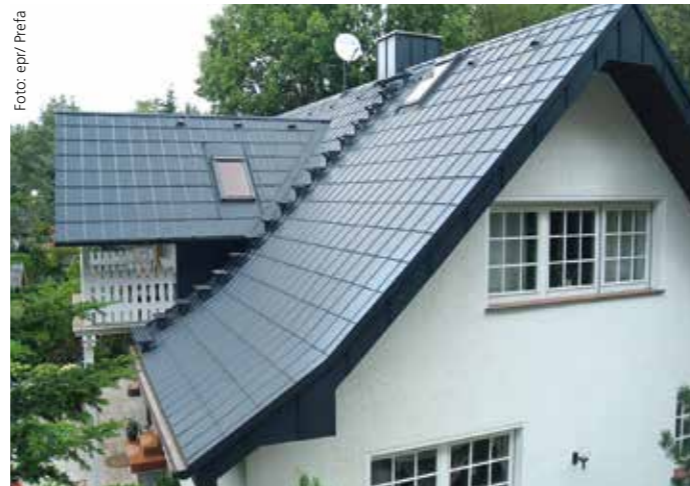
Creaton AG neben einem vielfältigen Tondachziegelsortiment optimal aufeinander abgestimmtes Originalzubehör, vom Ortgang zum

Originalzubehör schafft Sicherheit Damit „alles sitzt, passt, Luft hat und nichts wackelt“, bietet die