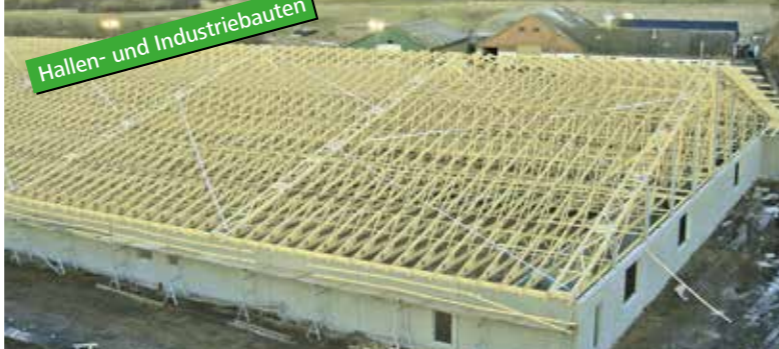
Hallen- und Industriebauten