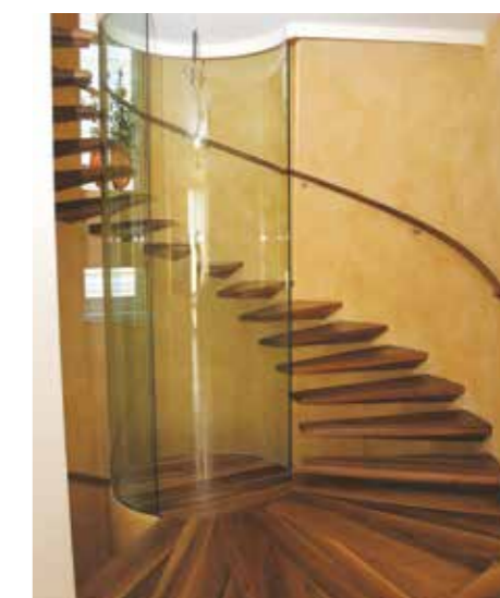
Frei auskragende Massivholzstufen aus Nussbaum rund um ein verglastes lichtdurchlässiges Treppenauge