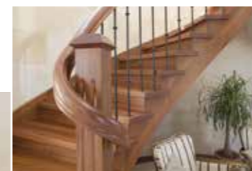
Diese formschöne Massivholztreppe aus dunklem Sapellholz mit gebogenen schichtverleimten Wangen fügt sich elegant in das helle Ambiente ein

Augustental 47 24232 Schönkirchen Telefon 04348/ 919 78 53 E-Mail: ikracht@arktic.de