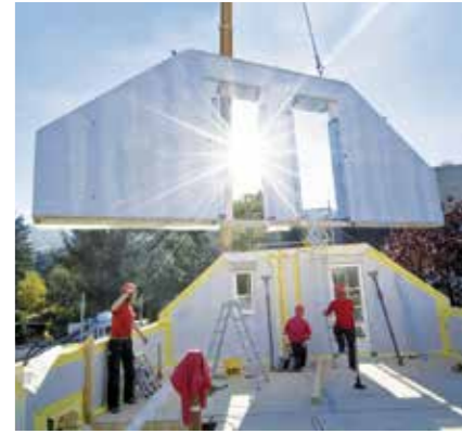
Neubau statt Sanierung: Ein Holzfertighaus ermöglicht einen schnellen Einzug ins neue Eigenheim

„Alles in allem können so schnell Kosten von weit mehr als 100.000 Euro zusammenkommen. An diesem Punkt stellt sich die Frage, ob der Bau eines neuen Hauses nicht die bessere Vorgehensweise ist“, so Klaas. Damit investiert man sein Geld beileibe nicht nur in mehr Energieeffizienz und eine neue Haustechnik. Bei vielen alten Häusern, die bis in die 1970er Jahre hinein gebaut wurden, waren zum Beispiel die Küche oder das Bad auf reine Funktionalität hin ausgelegt und von der Grundfläche her sehr klein. Heute jedoch sind gemütliche Wellness-Oasen und offene Wohn-, Ess- und Kochbereiche gefragt. „Solche Umbauten sind in einem Altbau unglaublich aufwändig und kosten eine Menge Zeit und Geld. Dagegen können beim Bau eines Holzfertighauses alle Räume exakt nach den Wünschen des Bauherrn