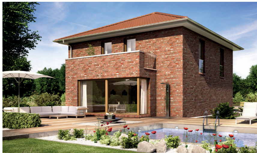
Ob Stadtvilla, Bungalow oder klassisches Friesenhaus, das neue Baugebiet bietet viele Möglichkeiten. Mit einer Verblenderfassade versehen, passen sich die Häuser in die regionale Bauweise ein

Mit dem Massivhausanbieter Heinz von Heiden steht Bauinteressenten ein kompetenter Partner zur Seite. Heinz von Heiden trägt dem Lebensstil und der Bauweise Norddeutschlands Rechnung. Bauen Sie in Büsum Ihr regionaltypisches Haus, das bewusst den norddeutschen Baustil aufnimmt und diesen modern interpretiert. Harmonisch mit der Landschaft verbunden setzt es die Tradition fort, ohne jedoch auf modernste Ausstattung zu verzichten. So haben alle Heinz-von-Heiden-Massivhäuser ein optimales Preis-Leistungs-Verhältnis und bieten den von Ihnen individuell gewünschten Wohnkomfort und energieeffiziente Haustechnik.