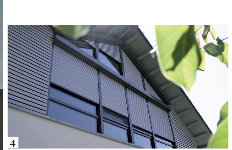
1 Außen liegender Sonnenschutz 2 Attraktive Sonnenschutzlösung 3 Sonnenschutz für das Dachfenster 4 Blickdichter Rollläden