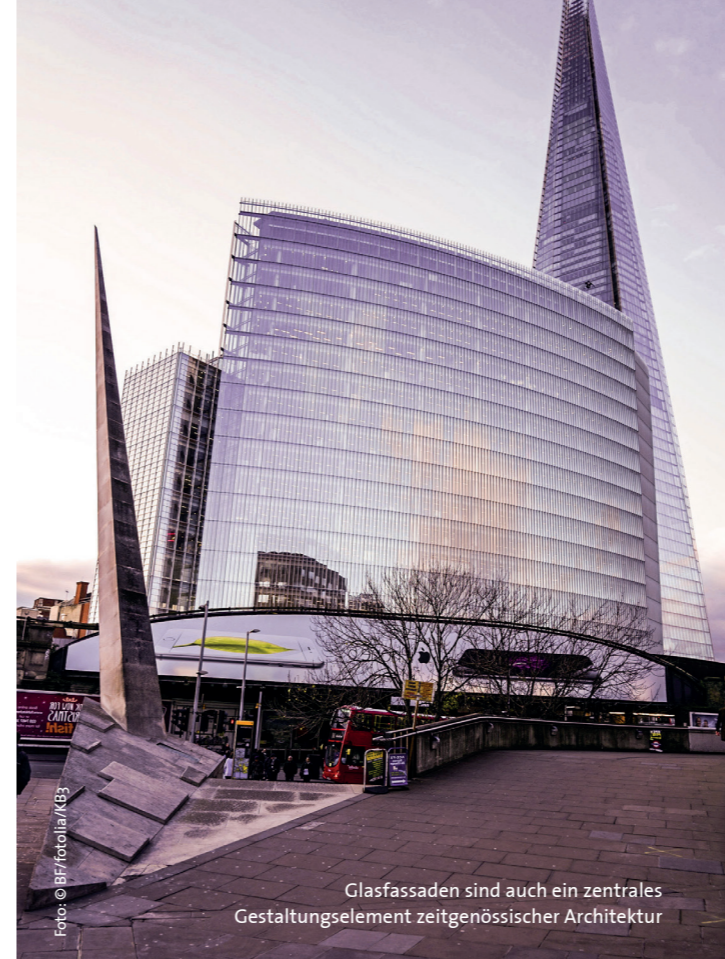
Glasfassaden sind auch ein zentrales Gestaltungselement zeitgenössischer Architektur

„Moderne Verglasungen wie die heute zum baulichen Standard gehörende Dreifachverglasung sind extrem effizient. Sie halten die Wärme im Raum, die Kälte vor der Fassade und bieten sich dank hervorragender Eigenschaften für den Einsatz äh-