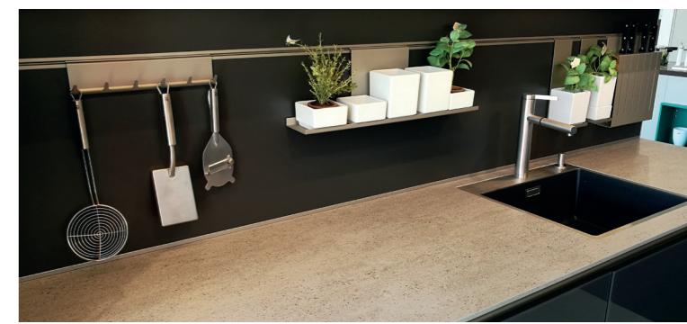
Neben maximaler Feuer- und Hitzebeständigkeit überzeugen vor allem Abriebfestigkeit und Fleckresistenz des „künstlichen Natursteins“

Dekton ist eine hoch entwickelte Kombination von Rohstoffen, die zur Herstellung von Glas, Keramik oder Quarzflächen verwendet werden. Es ist ein neues und innovatives Material, das Architektur und Design den Weg in die Zukunft der Oberflächen weist. Zum Einsatz kommt der Werkstoff in Küchen, Bädern und sogar als Boden oder an Fassaden. Für die Herstellung wird die exklusive Sinterpartikel-Technologie angewendet. Dabei werden wie im Zeitraffer metamorphe Veränderungen ausgeführt, durch die Naturstein im Laufe von Tausenden von Jahren entsteht, wenn er hohem Druck und hohen Temperaturen ausgesetzt ist. Dektons mechanische Eigenschaften eröffnen neue Design- und Verarbeitungsmöglichkeiten – auch in großen Abmessungen. Bei Küchen Brügge in Neumünster können Sie das Material und seine Einsatzmöglichkeiten in Augenschein nehmen.